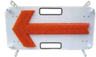
H-40 フラッシャーパネル

サイズ (板) W720×H360% ●発光ダイオード使用のため確認(ツグンです。 (単一2個使用(別途販売))