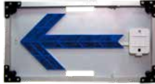
LEDフラッシュアロー(青)